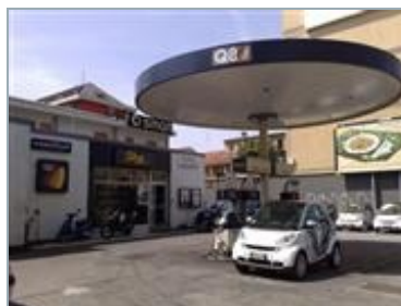
MILANO (MI) Via Famagosta 12